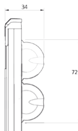
NANO BLIND DOUBLE